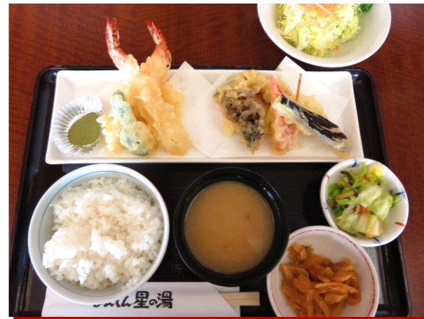
◆海老天ぷら定食 ■1,400円 ◆海老天ぷら単品 ■1,130円