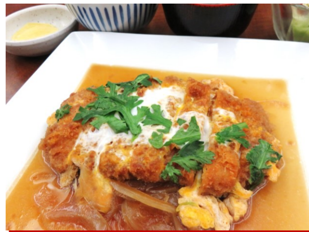
◆上州麦豚かつ煮定食 ■1,580円 ◆上州麦豚かつ煮単品 ■1,310円