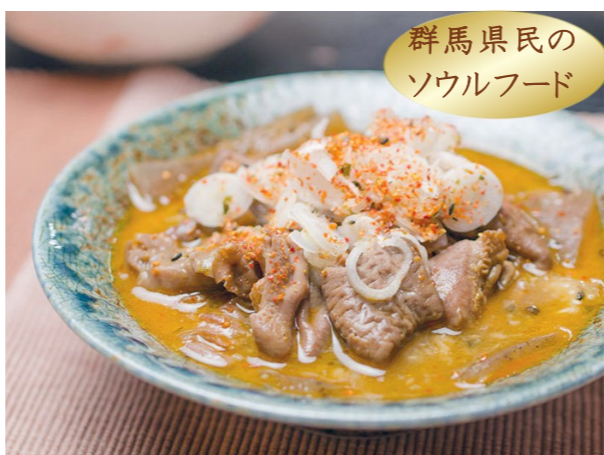
◆もつ煮込み定食 ■1,200円 ◆もつ煮込み単品 ■930円