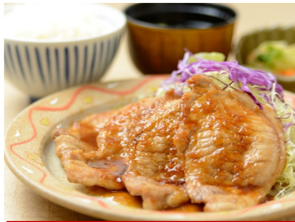
◆上州麦豚生姜焼き定食 ■1,580円 ◆上州麦豚生姜焼き単品 ■1,310円