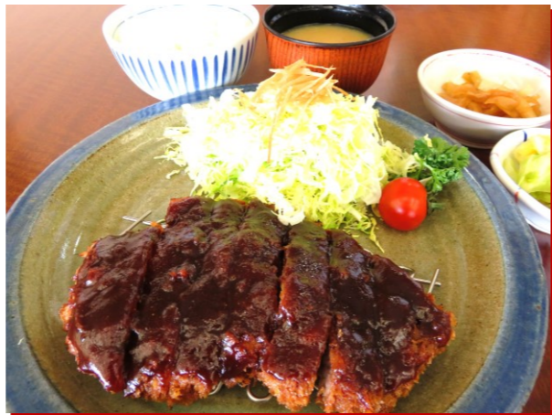
◆上州麦豚味噌カツ定食 ■1,580円 ◆上州麦豚味噌カツ単品 ■1,310円