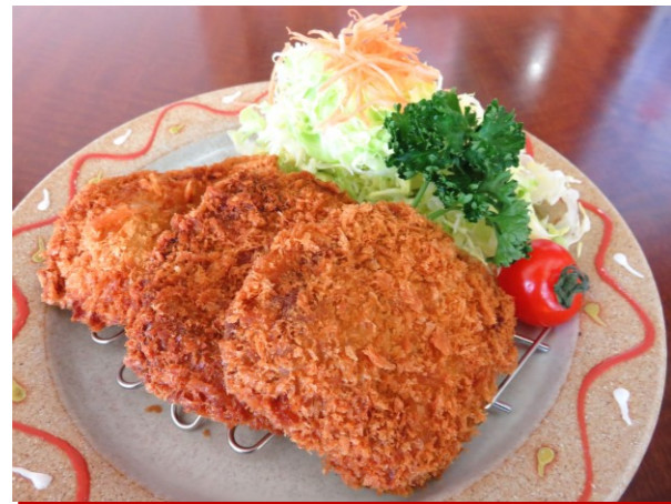
◆上州麦豚ヒレカツ定食 ■1,580円 ◆上州麦豚ヒレカツ単品 ■1,310円