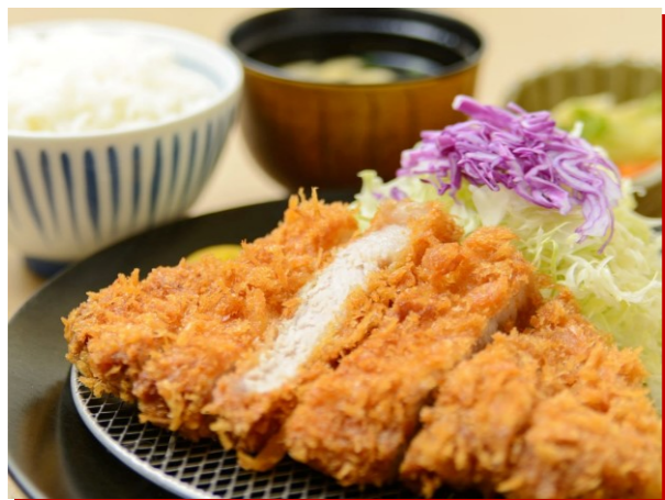
◆上州麦豚とんかつ定食 ■1,580円 ◆上州麦豚とんかつ単品 ■1,310円