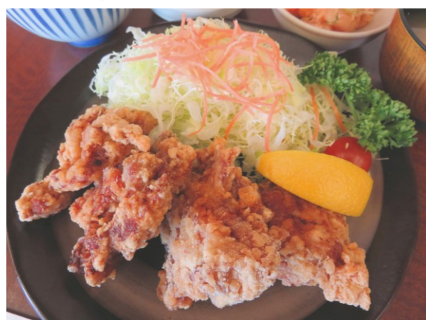
◆赤城どりのから揚げ定食 ■1,280円 ◆赤城どりのから揚げ単品 ■1,010円