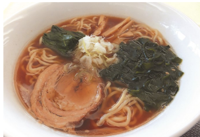
昔ながらのしょうゆラーメン